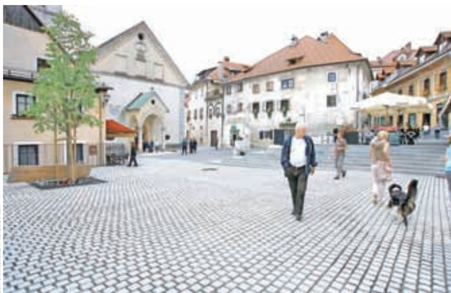
Letos urejena Cankarjev trg in Blaževa ulica postajata najlepši del Škofje Loke.

Škofja Loka. V tem mandatu so poskrbeli tudi za poplavno ureditev levega brega Selške Sore, s tem bodo nadaljevali še v Puštalu in na Sorški cesti s Studencem. Velik napredek je narejen tudi na športnem in kulturnem področju, Miha Ješe pa omenja tudi vse večje mednarodno odpiranje občine. Poleg devetih pobratenih mest so se v tem času pridružili evropskemu združenju Douzelage in združenju za proučevanje prostovoljstva Beneci, vsako leto v mestu gostijo vse v Sloveniji akreditirane veleposlanike in vojaške atašeje. Že prej je bila občina članica združenja zgodovinskih mest in pasijonskih mest. Prihodnje leto bo ponovna uprizoritev Škofjeloškega pasijona, nato pa znova ob tristoletnici nastanka Marušičevega pasijona 2021, ko upajo tudi na papežev obisk.