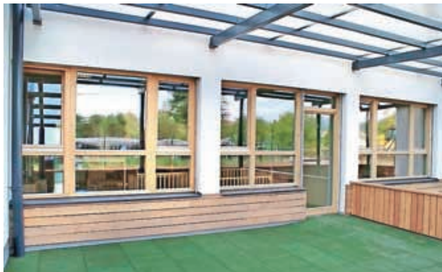
Nova okna v vrtcu v Lescah