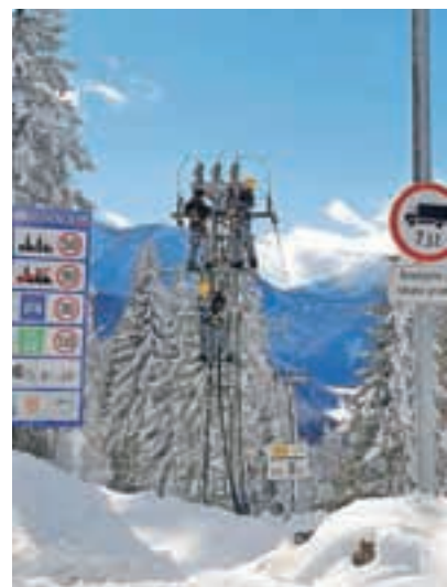
Zaradi posledic žledoloma nam je z neprecenljivo pomočjo podjetij Elektro Gorenjska in Kelag ter Občine Železna Kapla in Generalnega konzulata RS Celovec uspelo zgraditi električno povezavo med Jezerskim in sosednjo Avstrijo.