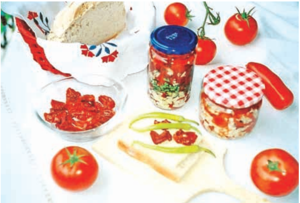
Posušeni paradižniki v olivnem olju

(3 kg). V predalčke položimo papir za peko in nanj prerezane paradižnike. V sušilniku se sušijo na srednji temperaturni stopnji približno 8 do 10 ur. Manjšo količino, 1,5 do 2 kg, kolikor jih gre na običajen pekač, lahko posušimo kar v električni pečici. Jaz imam pečico brez ventilatorja in v njej jih sušim čez noč, to je približno 12 ur, pri 75 stopinjah C, z malo priprto pečico. Nato jih sušim še na soncu (če je dovolj vroče) čez dan ali pa namesto sonca dalj časa v pečici.