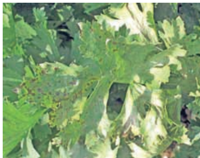
Listna pegavost zelene