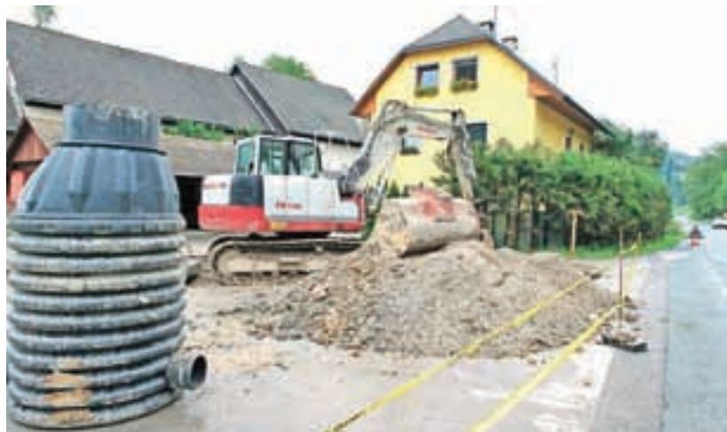
Na Gorenjskem v zadnjih letih na veliko gradijo komunalno infrastrukturo.

prebivalcev (okoli 56 tisoč). Sledijo ji občine Domžale, Kamnik, Škofja Loka in Jesenice. Najmanjša je občina Jezersko z manj kot tisoč prebivalci.