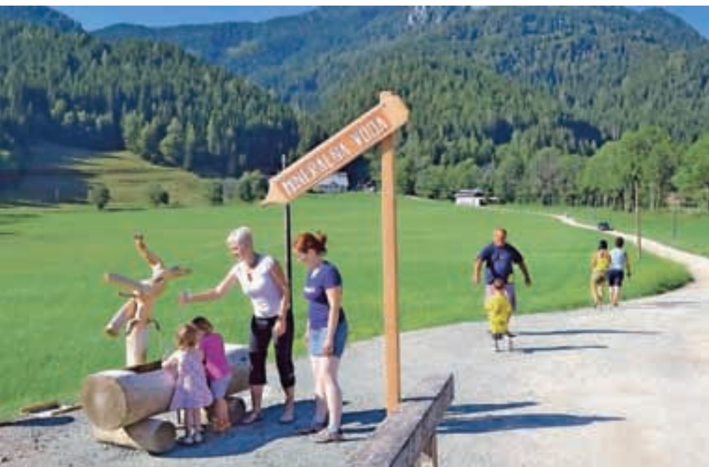
Točilno mesto jezerske mineralne vode