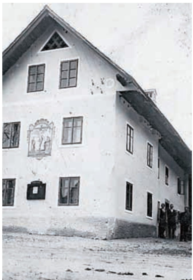
Dom v Predtrgu

Imel sem »Befehl (ukaz)«, naj se čez tri tedne zglašim v štabu v Področici. Trenutna zmaga na soški fronti in moje vojaško napredovanje me nista zaslepila. Slutil sem, da se kljub italijanskemu porazu vojna ne bo končala še tako kmalu. Informacije iz Alzacije in Lorene so bile slabe. Doživel sem preveč, da bi verjel vojaški propagandi. Toliko slovenskih družin je bilo prizadetih, toliko kameradov sem izgubil. Pokopavali smo po tri v eno rakev. V zaledju je vladala lakota. Mati so omenjali otroke, ki so v sirotišnicah umirali od griže, pa tudi od sestradanosti. Vse je šlo za vojsko. Misel, da se bom