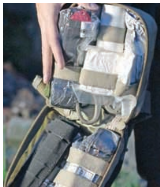
Paket prve pomoči, ki si ga novinarji in fotografi lahko pritrldijo na nogo.