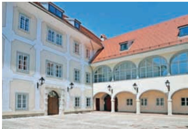
Staro mestno jedro s celovito obnovo kompleksa Gradu Khislstein