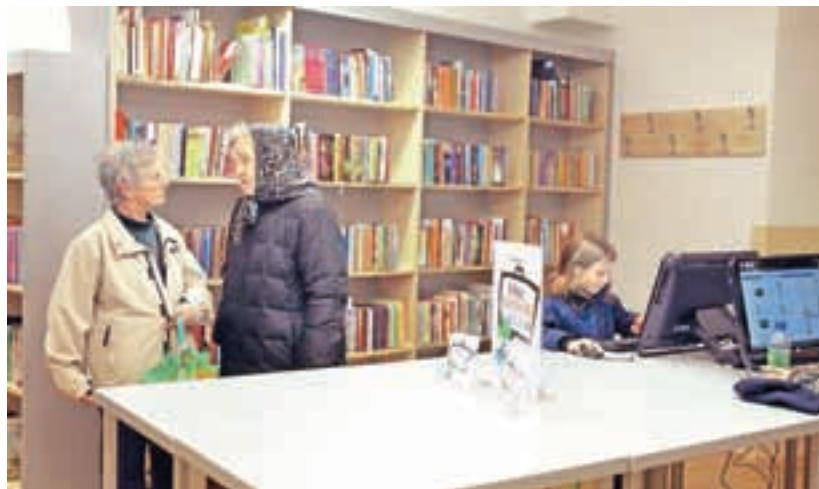
Nova knjižnica, mesto srečanj vseh generacij / Foto: Tina Dokl

Danes so na Gorenjskem naslednje občine: Bled, Bohinj, Cerklje, Domžale, Gorenja vas - Poljane, Gorje, Jesenice, Jezersko, Kamnik, Komenda, Kranj, Kranjska Gora, Lukovica, Medvode, Mengeš, Moravče, Naklo, Preddvor, Radovljica, Šenčur, Škofja Loka, Trzin, Tržič, Vodice, Železniki, Žiri in Žirovnica. Edina mestna je med njimi občina Kranj, ki je največja tudi po številu