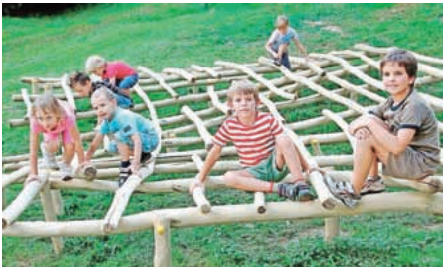
Župan izpolnjuje obljubo, da vsako leto uredijo vsaj eno otroško igrišče v občini.

cev. Občina je izpolnila obljubo, da bo vsako leto uredila vsaj eno otroško igrišče, tako so se najmlajši razveselili igrišč na Stari Savi, na Slovenskem Javorniku, na Pristavi, na Hrušici, v Planini pod Golico, na Blejski Dobravi in na Kočni. »V Planini pod Golico smo v večnamenskem objektu uredili prostore za gasilce, krajevno skupnost, društva in informacijsko točko, na Hrušici pa smo namenu predali prizidek h kulturnemu domu,« je dejal župan. Ljudska univerza Jesenice je dobila nove prostore, Visoka šola za zdravstveno nego Jesenice, katere ustanoviteljica je Občina Jesenice, pa je izpolnila pogoje za preoblikovanje v Fakulteto za zdravstvo Jesenice. Ob tem je velika pridobitev tudi sprejetje enega najpomembnejših razvojnih dokumentov, to je občinskega prostorskega načrta, ki načrtuje nadaljnji prostorski razvoj občine in s spremembami katerega se Občina v želji po čim večjem uspehu jeseniškega gospodarstva tudi prilagaja potrebam le-tega. V tem mandatu so Jesenice dobile tudi nov Upravni center Jesenice, novo stavbo pošte, neprofitna stanovanja na Prešernovi cesti, najsodobnejši heliport na strehi garažne hiše v bolnišnici, avtokamp Perun, novo lekarno Plavž. Zaživela je Univerza za tretje življenjsko obdobje, Razvojni center Jesenice, začela se je gradnja urgentnega centra.