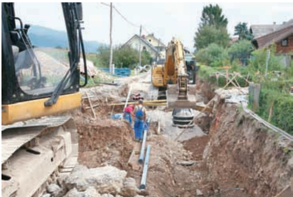
Severni del občine Šenčur je zaradi gradnje primarne in sekundarne kanalizacije ta čas eno samo gradbišče.